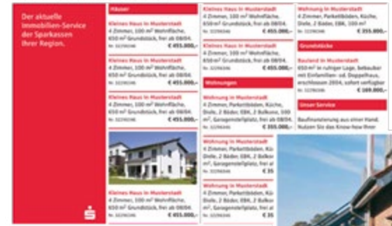
Beispiel: Anzeige in der lokalen Presse

Immobilien verkaufen, am besten mit uns.